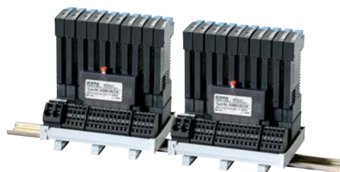
Sistema di distribuzione SVS09-10 equipaggiato con interruttori elettronici tipo ESS20